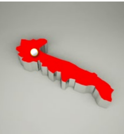
ALBEROBELLO I Trulli