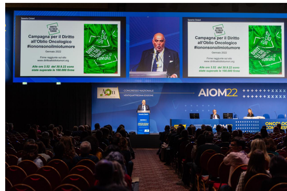
Diretta della Cerimonia Inaugurale