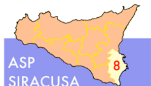
AZIENDA SANITARIA PROVINCIALE